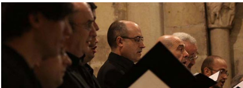
El Coro de Cámara de Madrid la semana pasada en Segovia, en un concierto del Proyecto Victoria. | R. Blanco